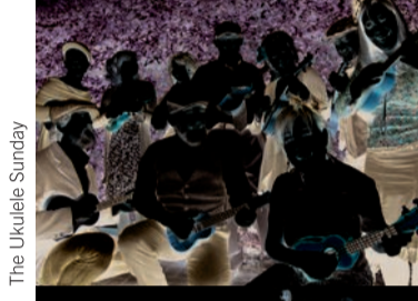
The Ukulele Sunday