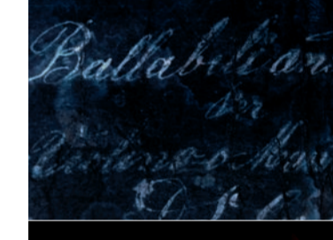
Gruppo Folkloristico "Val Resia"