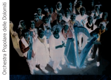
Orchestra Popolare delle Dolomiti