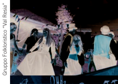
Gruppo Folkloristico "Val Resia"