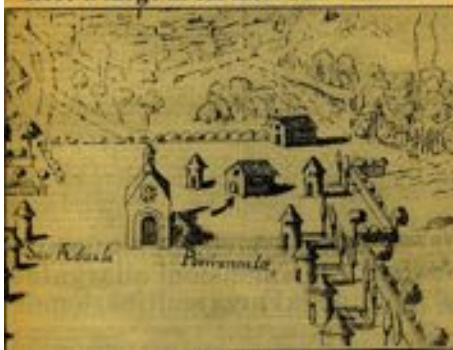
Ecco il luogo in cui morì San Francesco

Ils sont laïques et non prêtres, et il faut se rappeler que, à partir de 1179, Pierre Valdo et les Pauvres de Lyon avaient été condamnés puis excommuniés pour avoir prêché publiquement et en langue vulgaire (Innocent III avait interdit la possession de Bibles en français), malgré l'interdiction pontificale puis épiscopale de Lyon : seuls les prêtres ont le droit de prêcher, pas les laïques. Mais la Curie romaine